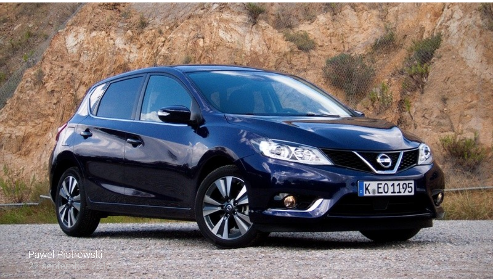
Pawel Piotrowski 22 september 2014